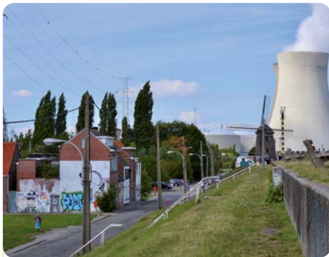
In heel Doel wonen nog amper negentien mensen.