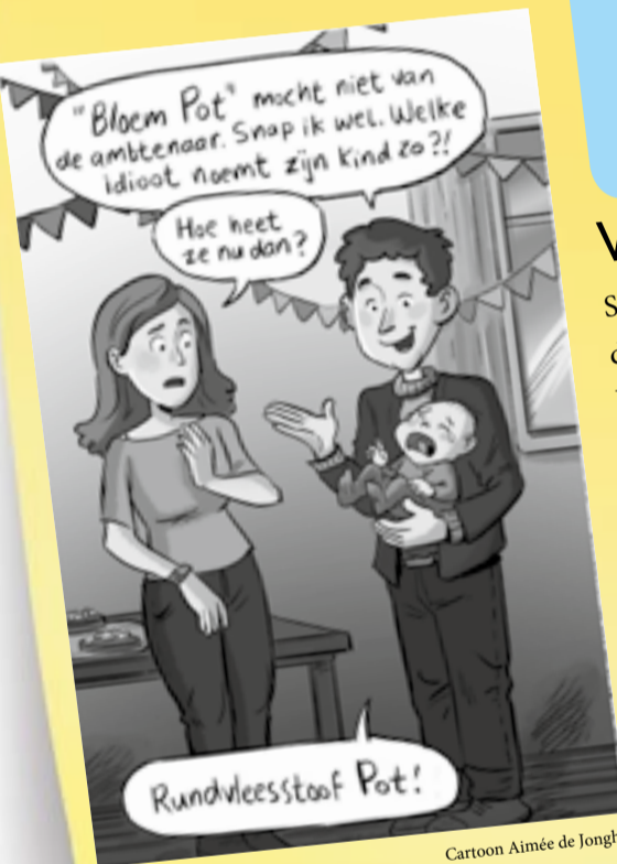
Cartoon Aimée de Jongh