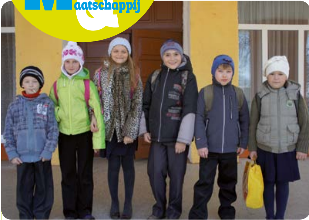
De jaarlijkse gezondheidsvakantie in België doet de kinderen van Tsjernobyl deugd.