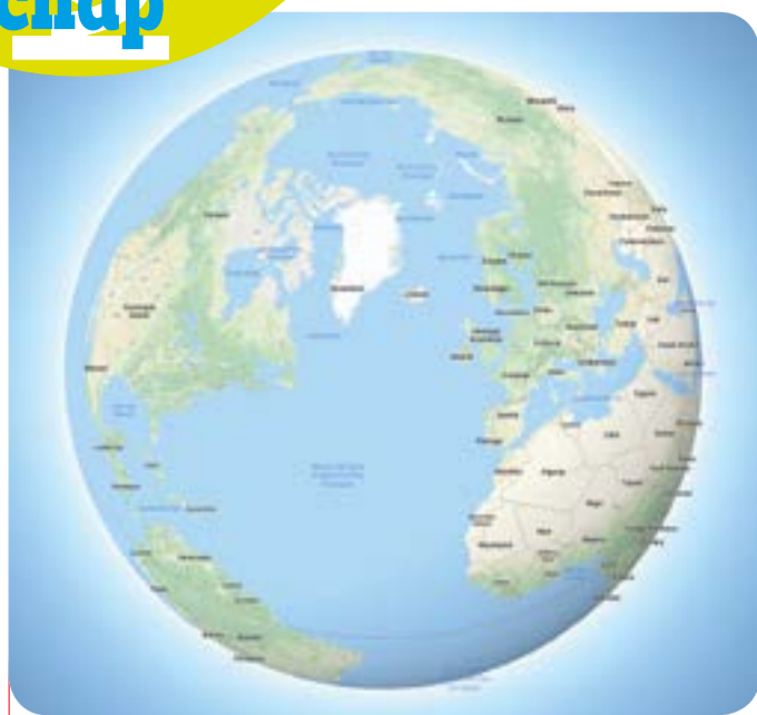
Nu is ook bij Google Maps de aarde rond.