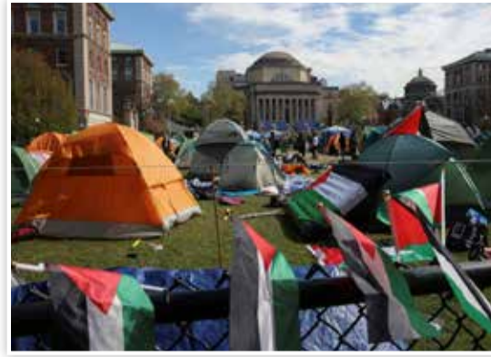
Het tentenkamp bij de Columbia Universiteit in New York.

Intussen maken de universiteiten zich zorgen over de veiligheid, vooral van joodse studenten. Op veel plaatsen was er al geweld