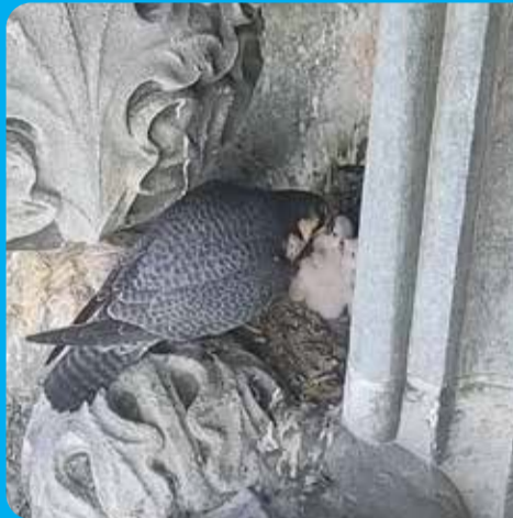
Beeld uit livestream Slechtvalk Sint-Romboutskathedraal

MECHELEN | Al enkele jaren kiest een koppel slechtvalken de Sint-Romboutstoren uit om hun nest te maken. Op dit moment staat de toren in de steigers, maar dat hield het valkenpaar niet tegen. Ze maakten een nest en broedden vier eitjes uit. De jongen vliegen normaal na zes weken uit. Hun ouders verzorgen hen goed. Zij vangen vooral vogels voor hun kuikens. Het is nog wel opletten voor de vogelgriep. Die ziekte vormt een bedreiging voor vogels in het wild.