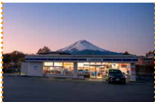
Dit is het beroemdste zicht op Mount Fuji.

Overall toeristen Ook dichterbij huis voeren steden nieuwe regels in tegen het massatoerisme. De Italiaanse stad Venetië vraagt vanaf nu 5 euro toegangsgeld op de 29 drukste dagen. Het Nederlandse Amsterdam stopt met de bouw van hotels. Griekenland en de Franse hoofdstad Parijs verhogen dan weer de toeristenbelasting. Barcelona in Spanje schrapt een populaire buslijn uit Google Maps.