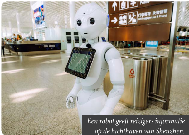
Een robot geeft reizigers informatie op de luchthaven van Shenzhen.

CHINA | In China is het nieuwe vijfjarenplan voorgesteld. Dat is een groot toekomstplan voor de jaren 2026 tot 2030. Wat wil het land bereiken? En zullen wij er iets van merken?