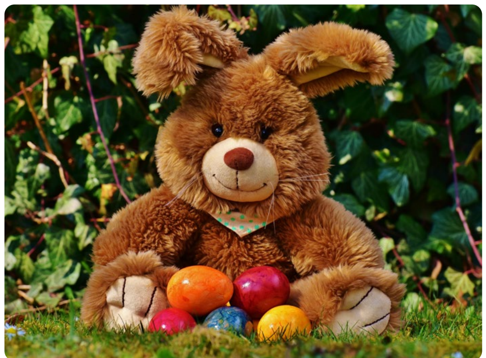
Bezorgt de paashaas binnenkort ook bij jou lekkere eitjes?