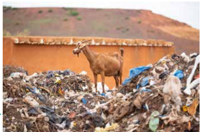
Staat dit dier binnenkort op een hoop vervallen vaccins?