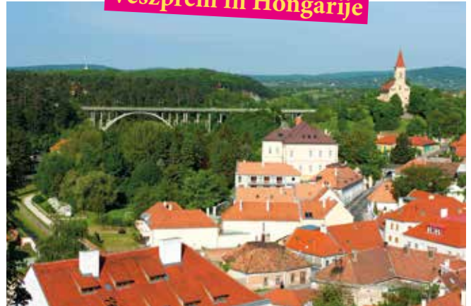
Veszprém in Hongarije

De geschiedenis van de stad Veszprém gaat terug tot de eerste Hongaarse koning, Stefanus I (1000 na Christus). Je vindt hier een van de eerste stenen kastelen van het land, naast veel middeleeuwse bouwwerken en smalle straatjes. In de zomermaanden zijn er verschillende muziekfestivals.