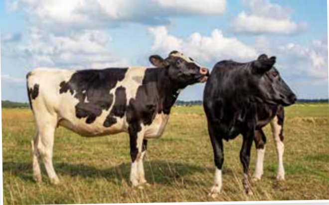
Door elkaar te likken, tonen koeien hun vriendschap.