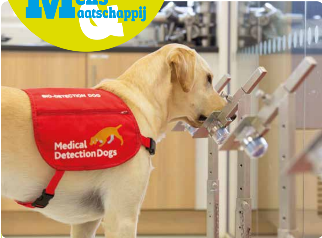
Honden worden getraind om het nieuwe coronavirus op te speuren.