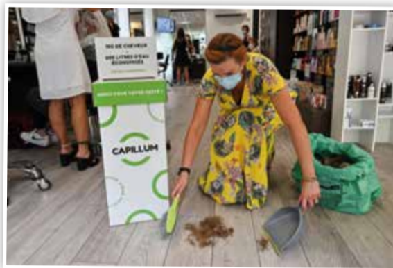
In Mauritius schenken veel mensen hun haren want één kilogram haar kan acht liter olie opzuigen.

geschikt om olie uit het water te halen. Het is trekvast, elastisch, hernieuwbaar en biologisch afbreekbaar . Als je een haar onder een microscoop bekijkt, zie je kleine schubben. Die zorgen ervoor dat niet het water, maar de olie zich hecht aan dat haar. Op Mauritius geven kapsalons kortingen aan wie haar doneert . Van het mensenhaar worden matten gemaakt. Na gebruik worden ze uitgewrongen en tot honderdmaal hergebruikt.