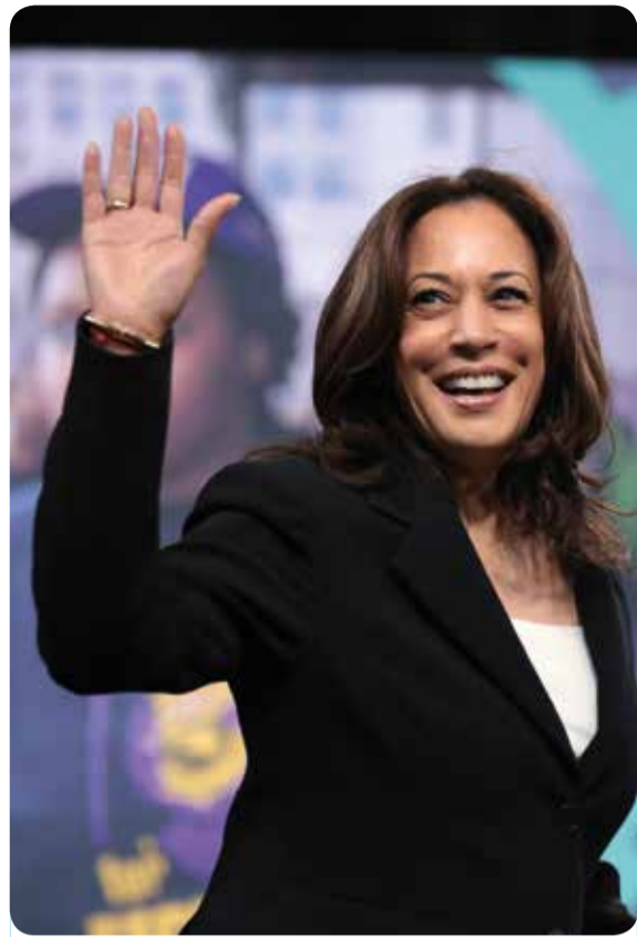
Kamala Harris is de sterke vrouw achter presidentskandidaat Joe Biden.

VERENIGDE STATEN | In november kiezen de Amerikanen een nieuwe president. Er zijn twee kandidaten. De huidige president, Donald Trump, neemt het op tegen Joe Biden.