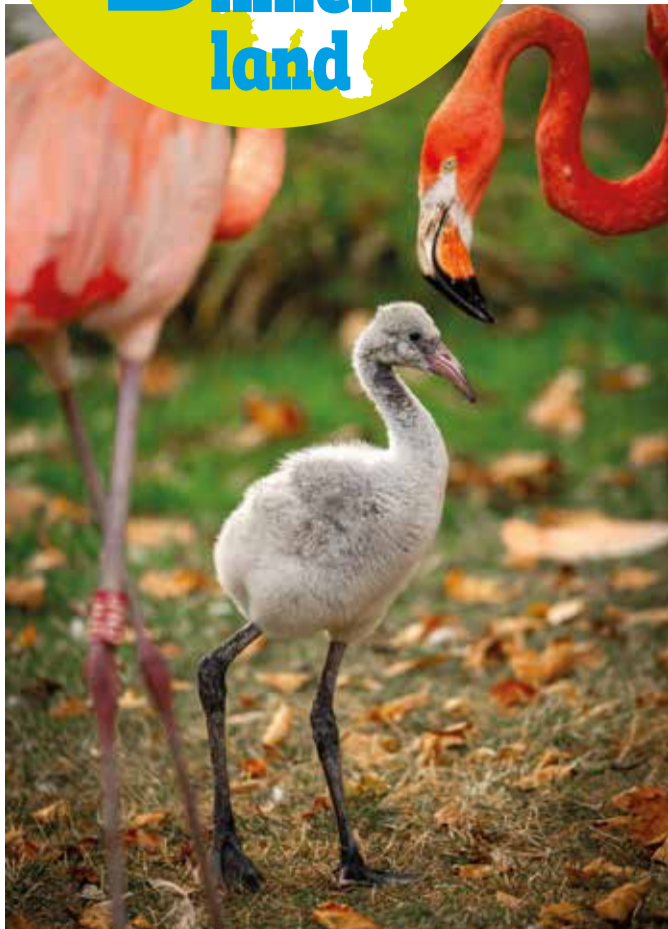
Flamingo's krijgen hun kenmerkende kleur door het eten van kreeftachtige diertjes.