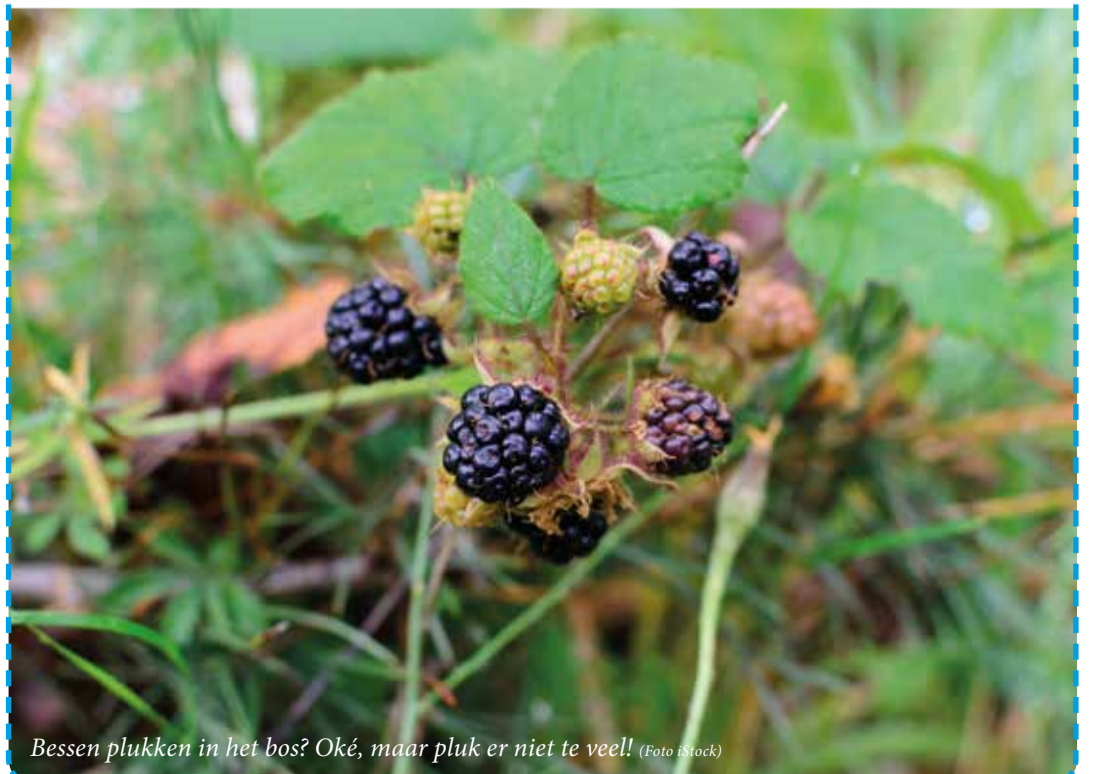
Bessen plukken in het bos? Oké, maar pluk er niet te veel!

Die regel is er om de biodiversiteit in onze bossen te beschermen. Tijdens een boswandeling enkele bessen plukken, ziet men door de vingers. Maar het is niet de bedoeling dat je hele doosjes vult. Dan riskeer je een boete. Zie je braamstruiken langs de openbare weg? Dan mag je plukken naar hartenlust. En ook op privéterrein. Mits toelating van de eigenaar, natuurlijk.